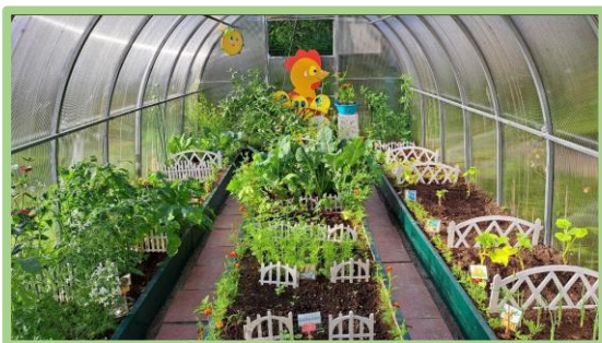
Точка 9. «Теплица»